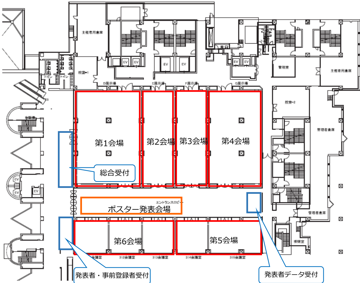
■ AIM 3階 会議室