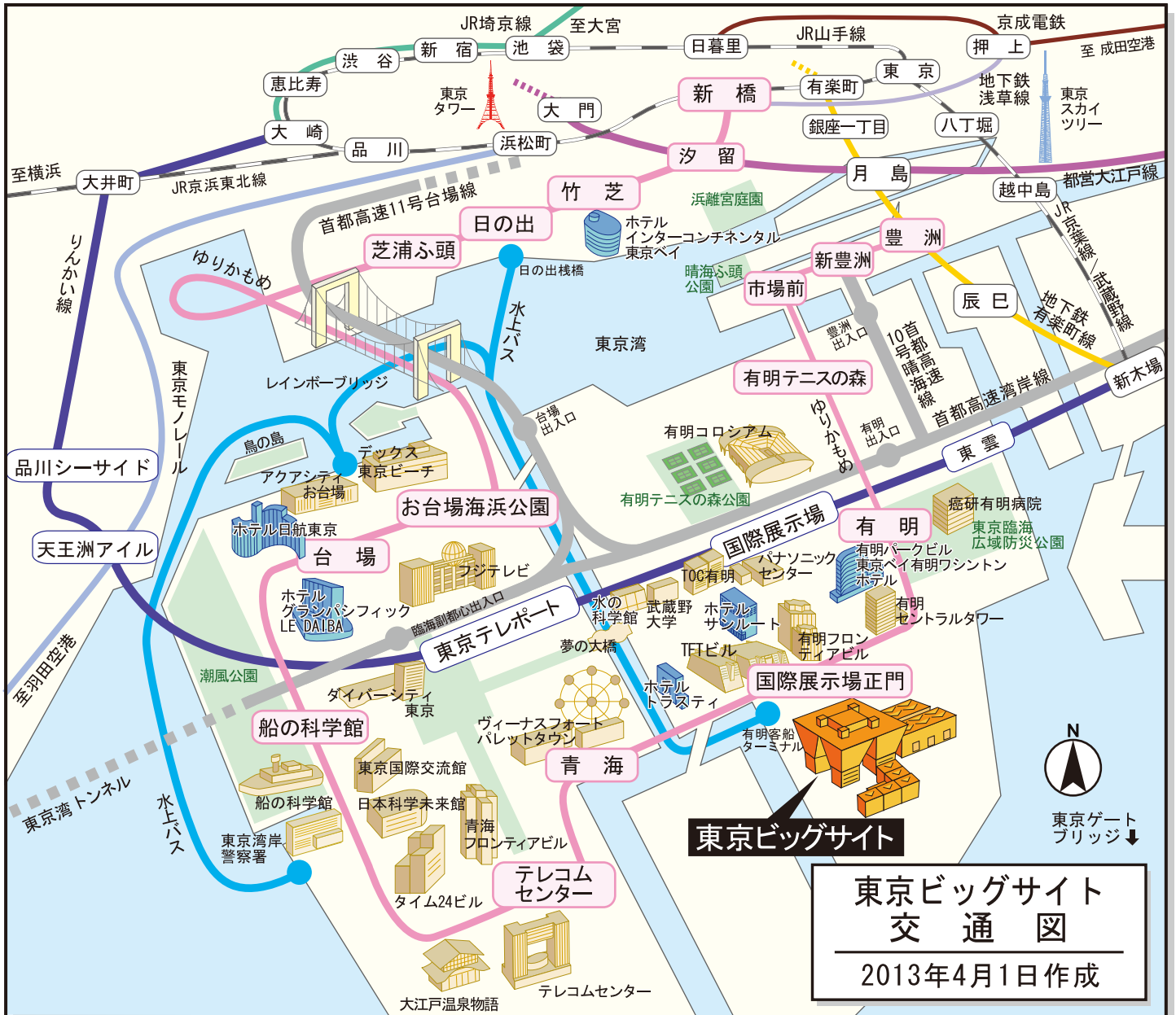
東京ビッグサイト 交通図 2013年4月1日作成